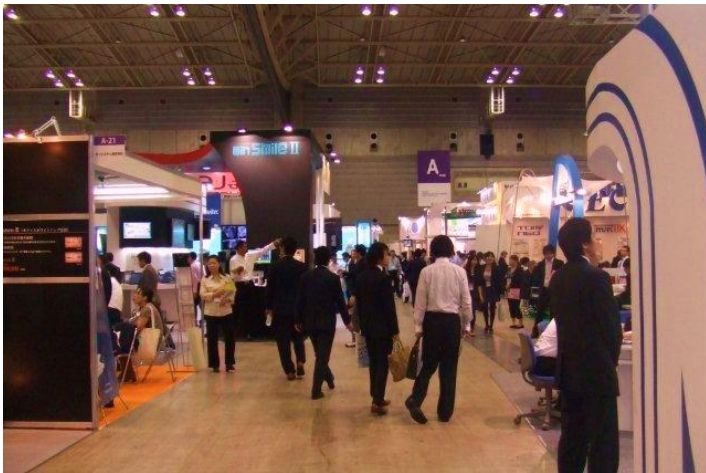
会場内は。熱気むんむん