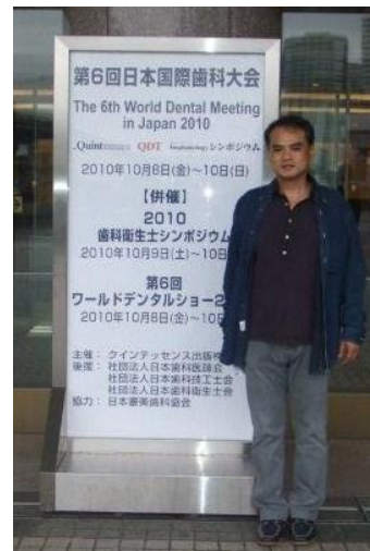
会場のパシフィコ横浜です