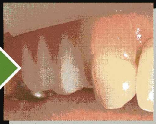
ノンクラスプデンチャー