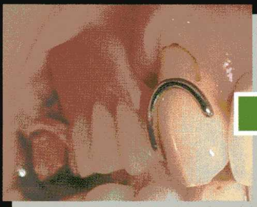
ばねのついた義歯