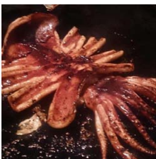
イカ焼きはボリューム満点

料理はもちろん美味しかったです、先輩先生方の会議では聞けない貴重なお 話も聞けて、飲みにケーション、やはり大事ですね。