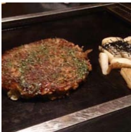
お好み焼きはふわふわ